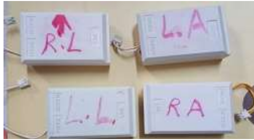
شكل (١) يوضح الاربعة وحدات الخاصه باليدين والقدمين

وهذه الوحدات الغرض منها تتبع حركة الجسم المثبت عليه عن طريق قياس العجلة والسرعة الزاوية وإرسالها ليتم معالجتها وفقا للبرنامج الموضوع لذلك شكل (١).