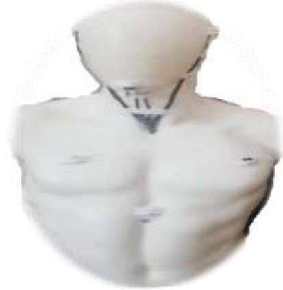
شكل (٤) يوضح الصورة الاولى للشاخص مثبت عليه الاضاءه والوصلات