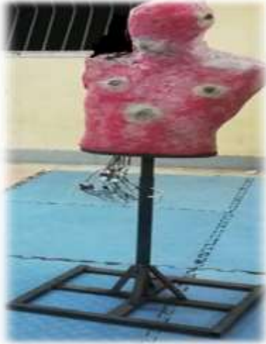
شكل (٣) يوضح الشاخص الإلكتروني الثابت